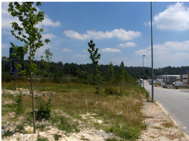
Ajardinamento de toda a zona industrial com a colocação de mais de 150 árvores.

Pavimentação do Caminho que liga o Lugar da Verdasca ao Outeiro.