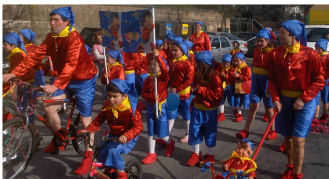
Tema Noddy apresentado pelo grupo Todos Diferentes Todos Iguais e lugares da Cruzinha e Capela no Carnaval 2007.