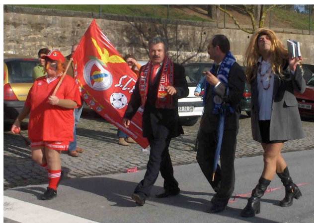
Tema Apito Dourado apresentado pelos lugares da Igreja e Penedo no Carnaval 2007.