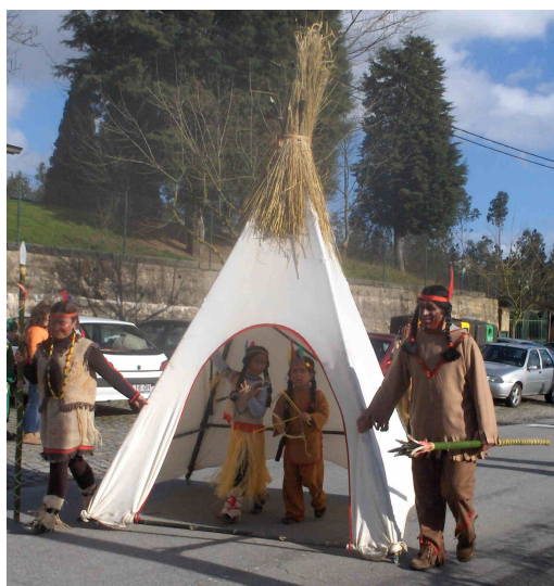
Tema Índios apresentado pelo lugar do Rego no Carnaval 2007.