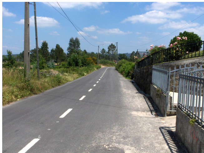
Pavimentação do caminho que liga o lugar da Verdasca ao Outeiro.